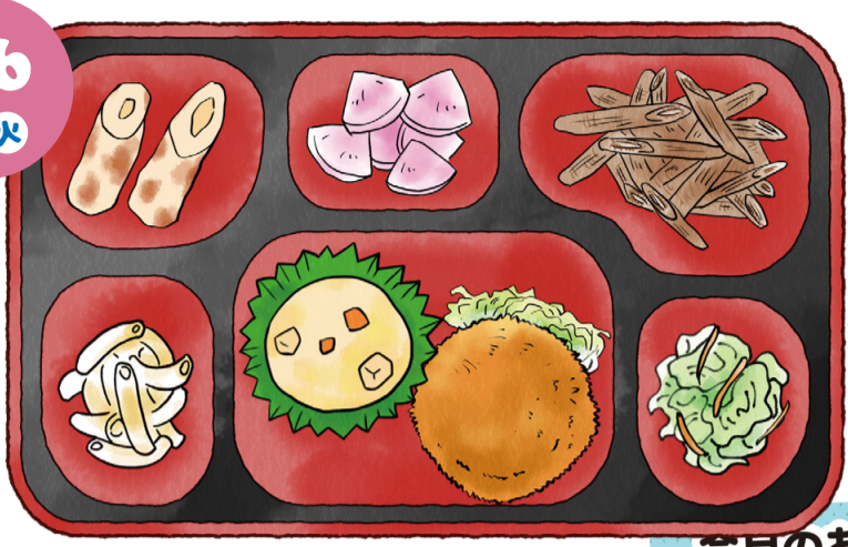
メンチカツ、シチュー